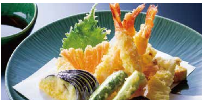
えび天ぷら盛り合せ