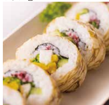
山菜巻(おぼろ海苔)